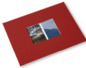
In de kaft van Picture Factory zit een venster

Ten slotte is er nog iets vreemds met het album van Picture Factory: in de kaft is een kader uitgesneden zodat de foto op de eerste bladzijde