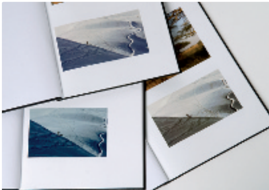
Drie CeWe-albums, drie afdrukresultaten

CeWe krijgt een matig oordeel voor constantheid: bij elk van de drie albums zagen we verschillende afdrukresultaten. Het hoogste testoordeel was vorig jaar voor Pixbook. Dit jaar krijgt Pixbook slechts een redelijk oordeel voor de fotokwaliteit. Het contrast is te hoog, waardoor details in lichte delen wegvallen. Foto's worden onnatuurlijk scherp weergegeven en zijn soms iets te blauw.